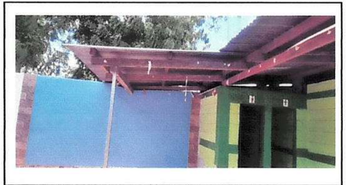
Mantenimiento a estructura metalica e instalación de lámina