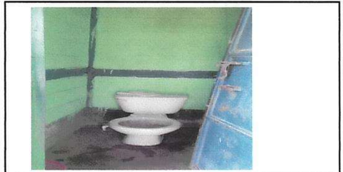
Sustitución de inodoros.

Observación: Si es necesario se pueden agregar hojas adicionales y actualizar el número de hojas.