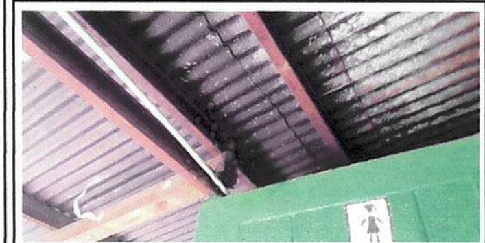
Matentamiento a estructura metalica e instalación de lámina