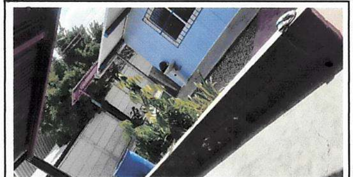
Colocación de piso cerámico